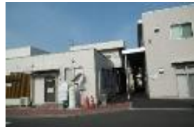
【事業所の場所】 桑野協立病院敷地内西側 2階建管理棟の左奥