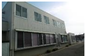
南側（ひかり薬局前） からみた事業所全景